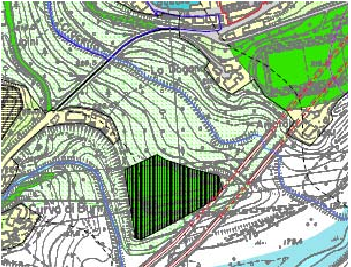
ESTRATTO TAVOLA D 01 del POC